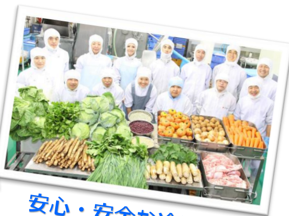
安心・安全な冷凍総菜 (株)ニッコー (大和市)