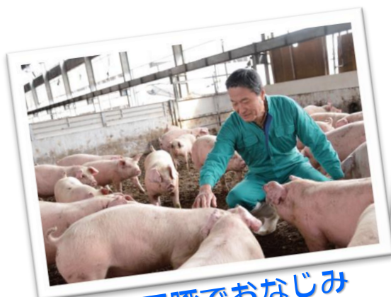
丹沢高原豚でおなじみ (株)丹沢農場 (愛川町)